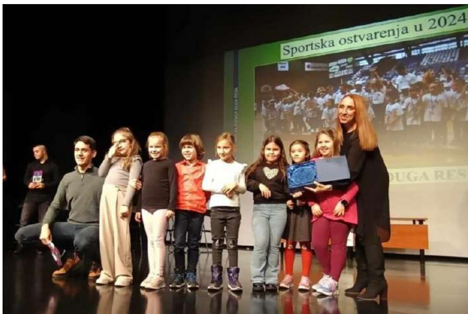
Slika 12. Dodjela priznanja za sportska ostvarenja u 2024. godini