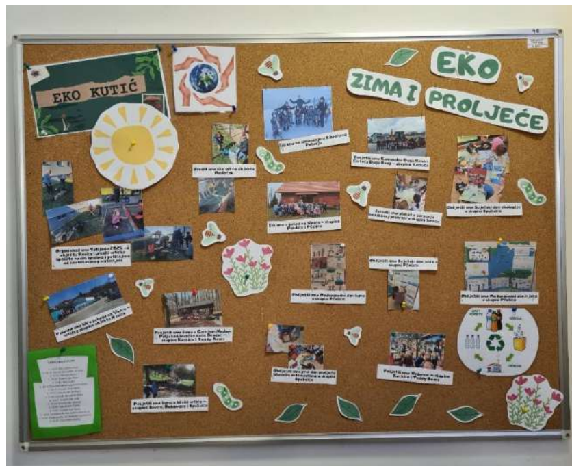
Slika 4. Eko-pano s aktivnostima provedenim u zimu i proljeće