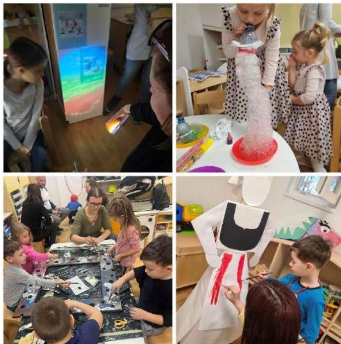
Slika 13. Radionice u sklopu Noći muzeja 2025.