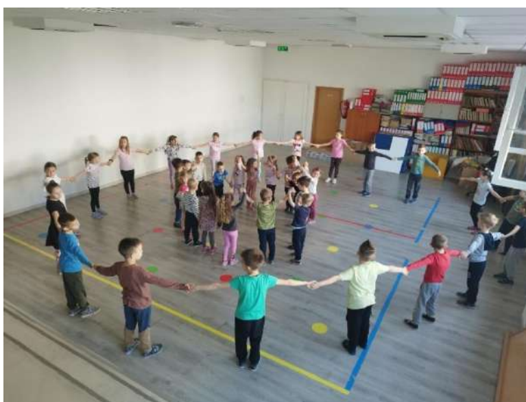
Slika 7. Obilježavanje Svjetskog dana plesa