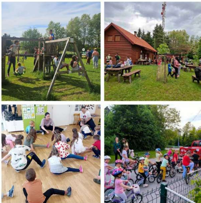
Slika 5. Obilježavanje projektnog eko-dana

zajedničkog provođenja vremena u prirodi, poticanja zdravih navika i očuvanja okoliša kroz aktivnosti u kojima zajedno sudjeluju djeca, roditelji i odgojno-obrazovni stručnjaci. Cilj je bio dodatno naglasiti važnost partnerstva između obitelji i vrtića u odgoju i obrazovanju djece, s posebnim naglaskom na razvoju svijesti o održivom načinu života i brizi za prirodu kod djece. Svaki objekt Dječjeg vrtića Duga Resa organizirao je svoj projektni dan koji je bio tematski povezan s ostvarivanjem ciljeva u sklopu programa Eko škole.