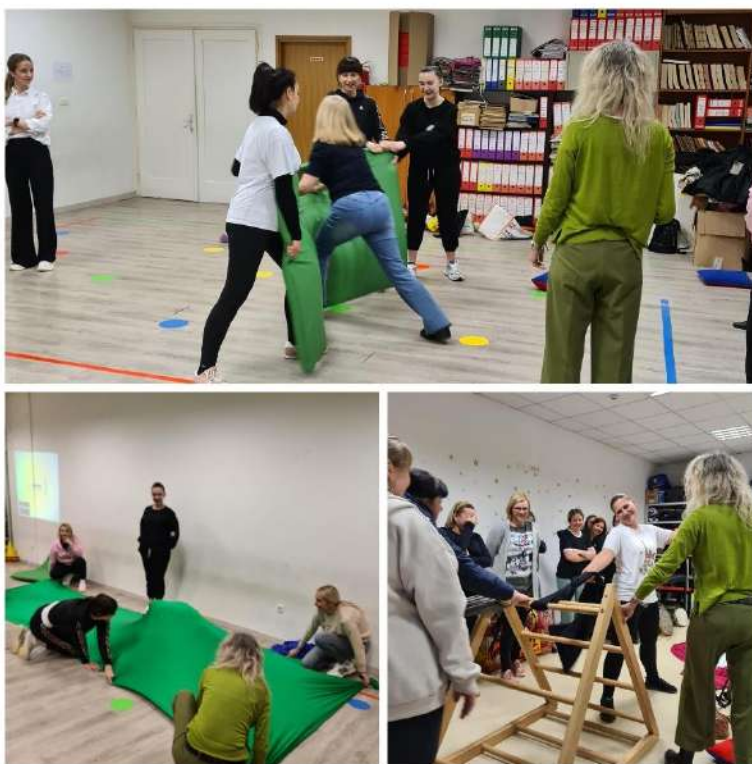
Slika 8. Edukacija “Razvoj pokreta i razvojni ritmovi kod djece”