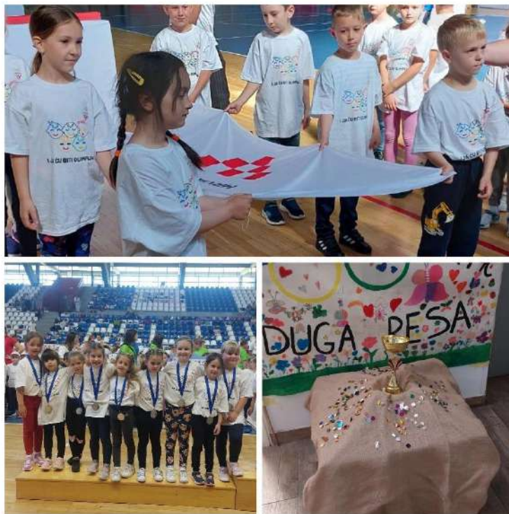
Slika 9. Sudjelovanje predškolaca na Olimpijskom festivalu dječji vrtića Karlovačke županije

Drugu godinu zaredom naši predškolci, na koje smo izuzetno ponosni, osvojili su prvo mjesto na Olimpijskom festivalu dječjih vrtića Karlovačke županije. Olimpijada se održala u Školskoj sportskoj dvorani Mladost u Karlovcu 14. svibnja 2025. godine, a na istoj je sudjelovalo deset ekipa iz cijele Karlovačke županije. Djeca su se natjecala u sljedećim disciplinama: mali nogomet, trčanje na 50 metara, štafeta 4x25 metara, bacanje loptice u dalj i skok u dalj. Dječji vrtić Duga Resa predstavljale su čak dvije ekipe – Duga i Resa. Ekipe Resa osvojila je prvo mjesto na Olimpijadi, s ukupno osvojenih 92 boda.