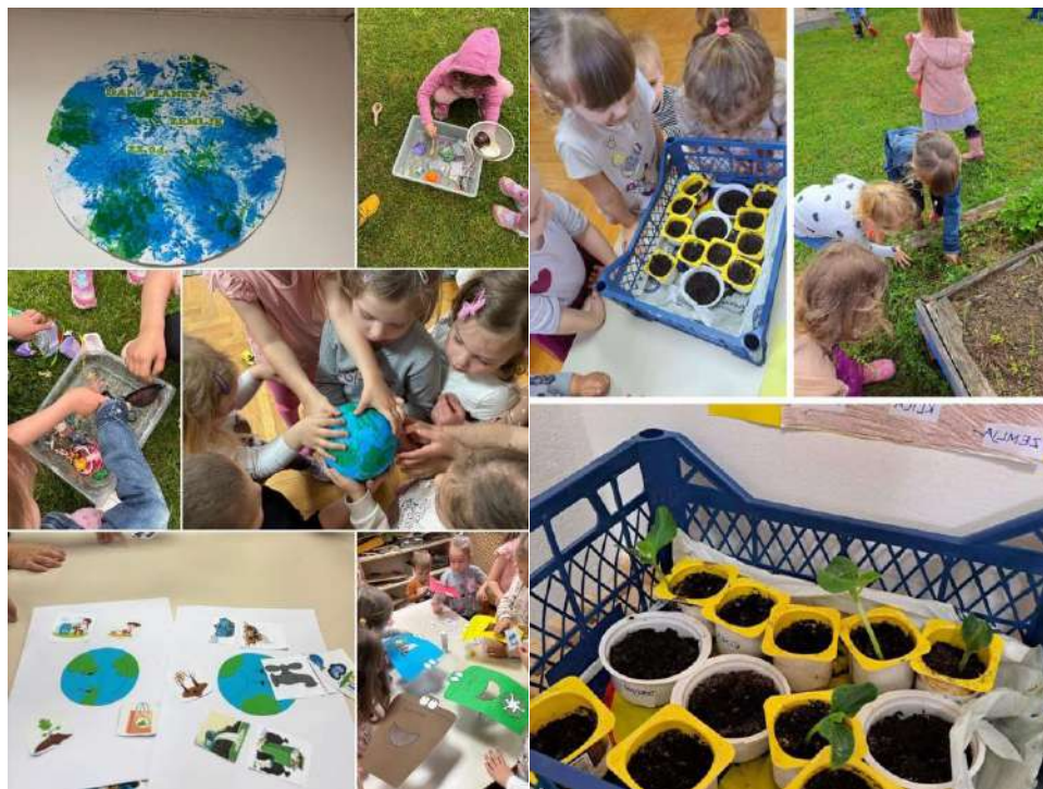
Slika 3. Prikaz aktivnosti povodom obilježavanja Dana planeta Zemlje

Vrijeme realizacije: tijekom cijele pedagoške godine 2024./2025.