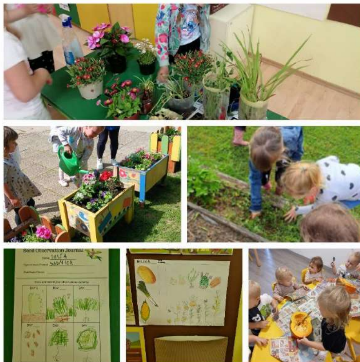
Slika 2. Prikaz aktivnosti u sklopu teme „Zajedno za prirodu“

Naziv teme: Obilježavanje ekoloških datuma