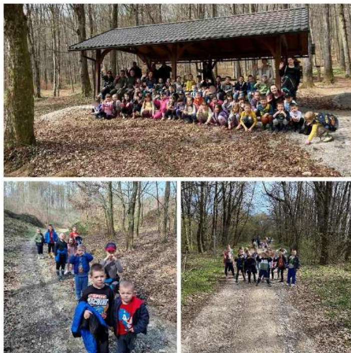
Slika 6. Obilježavanje prvog dana proljeća